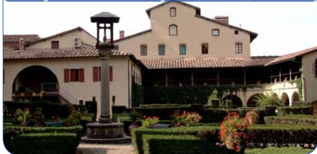
Immagine relative a Villa Casagrande (a sinistra), Villa La Palagina (al centro) e Casa Vinicola Carpineto (a destra)